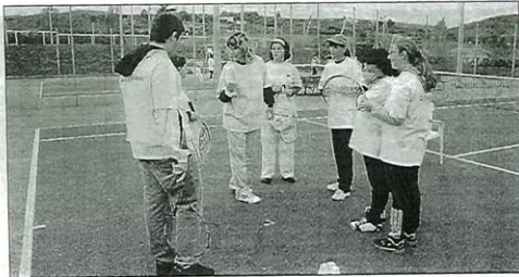
Les enfants ont découvert toute la matinée différents ateliers pour parfaire leurs revers et coups droits