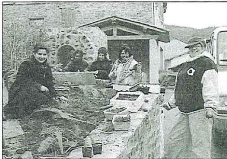
Malgré le mauvais temps les filles avaient le sourire

Ce petit groupe a bien travaillé à l'automne ce qui a permis de fournir des plantes vivaces pour d'autres massifs de la commune. La pluie et la neige en averses ont perturbé cette plantation mais elle sera reprise ces jours-ci. Espérons que tous ceux qui fleurissent leurs balcons ou fenêtres rendent le petit village bien accueillant ce été.