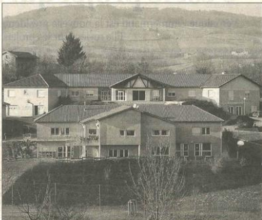
Les normes de sécurité au sein de l'IME sont bien au dessus de l'obligation légale

Mais les règlements évoluent au fil des ans, parfois très rapidement. Il suffit d'un accident à l'autre bout de la France dans ce type d'établissement pour qu'une nouvelle réglementation soit imposée à tous. Il y a deux ans nous avons dû doubler tous les blocs de secours et