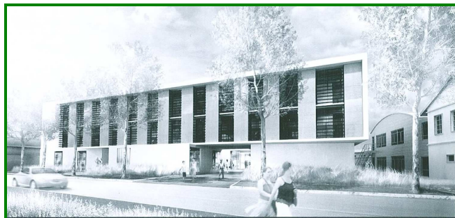
Le Reynard à l'horizon 2010

Le foyer occupationnel "Le Reynard" est un foyer de vie agréé pour accueillir en hébergement, en accueil temporaire de jour et en hébergement des hommes et des femmes souffrant de handicaps mentaux entraînant notamment des troubles de la relation et de l'apprentissage.